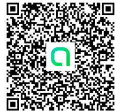
オープンチャット QRコード

公式掲示板を設置せず、当協会の LINE オープンチャットにて情報を発信していきます。競技会中のスタートリストも同様に掲載していきます。